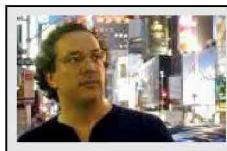
Uri Caine. Il pianista jazz tra gli ospiti di OyOyOy!